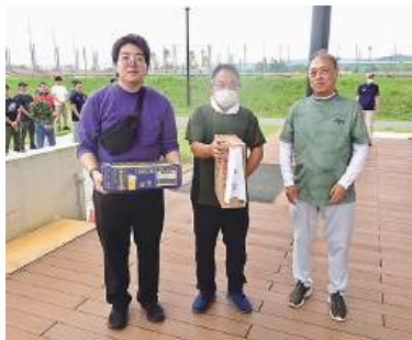
福島第三支部 パークゴルフ大会表彰式

最後に、事業広報委員をはじめ大会の開催にあたり準備してくださった皆様に感謝いたします。