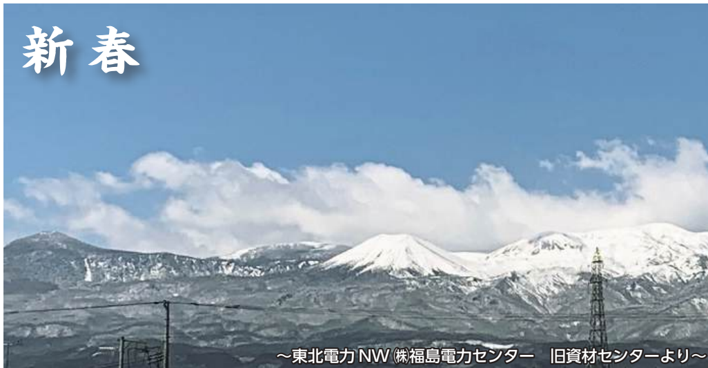
～東北電力NW(株)福島電力センター 旧資材センターより～