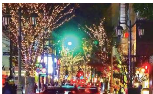
イルミネーションに彩られたパセオ通り

パセオ通りは12月6日(金)午 後5時30分、駅前同日の午 後6時にイルミネーションが 点灯され、福島市民の心に、 希望の光が灯されました。