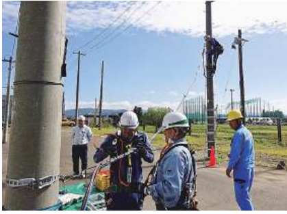
東北電力 NW 様指導のもと実施