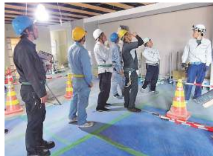
建設工事現場を視察