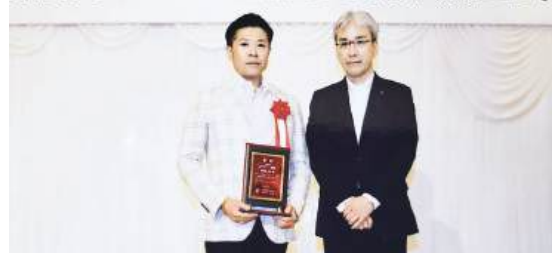
表彰を受ける茅原社長(左)