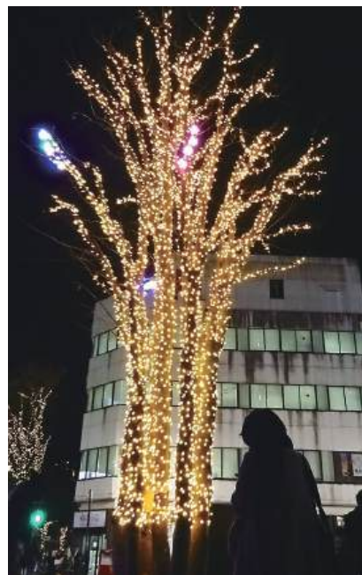
街なか広場の大ケヤキ